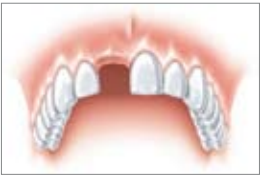
Un dente perduto, per esempio in seguito ad un incidente durante lo sport