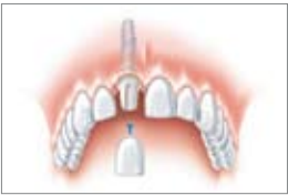
L'impianto inserito con la nuova corona dentaria