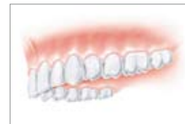
Estetica naturale, funzione naturale