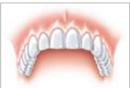
Una chiostra di denti completa in modo naturale

Può capitare a chiunque di perdere un singolo dente. Molto spesso perfino entro pochissimi secondi: basta un piccolo incidente durante lo sport, e già si ha un dente in meno. Ci si prende sicuramente uno spavento, ma oggi giorno non è più un dramma.