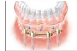
Protesi su quattro impianti nella mandibola

Al momento dell'inserimento, questi due elementi si collegano in modo simile ad un pulsante: la vostra protesi è fissa. Per la pulizia potete rimuoverla in qualsiasi momento. Su almeno sei impianti è anche possibile ancorare permanentemente un ponte alla mascella. In questo modo la protesi dentaria è talmente salda da poter rinunciare al materiale plastico rosa di sostegno per protesi. Il palato nella mascella superiore rimane comunque libero da materiale per protesi. In questo modo potete godere in qualsiasi situazione della massima sicurezza, poiché niente può staccarsi inaspettatamente. Con i vostri nuovi denti potrete mangiare, parlare e ridere proprio come se fossero quelli naturali.