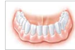
La protesi è fissata saldamente