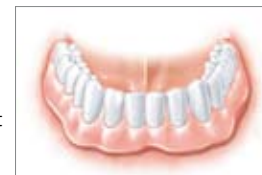
La prothèse dentaire est fermement fixée