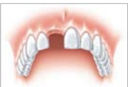
Une dent perdue, par exemple lors d'un accident de sport