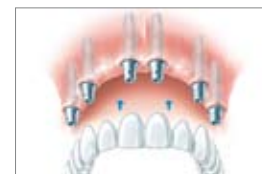
Dans la mâchoire supérieure: bridge sur six implants