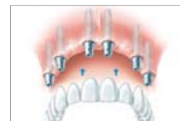
Im Oberkiefer: Brücke auf sechs Implantaten