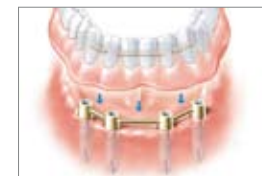
Underkæbeprotese på fire implantater

Når du mangler alle eller næsten alle tænder i undermundten, kan du med implantater alligevel få noget at grine af. For kun to til fire implantater er nok til, at en helprotese sidder godt fast. Den sidder fast med et specielt fastgørelsessystem, der består af to elementer. Det ene fastsættes permanent på implantatet, modstykket indarbejdes i protesen. Når elementerne sættes fast, forbindes de ligesom en tryklås. Så sidder din protese fast. Du kan let tage den ud igen, når den skal rengøres. På mindst seks implantater kan der også fastgøres en bro permanent på kæben. Tandprotesen sidder dermed så fast, at det støttende rosa proteseplast kan undværes. I overkæben er der i hvert fald intet behov for protesemateriale i gummen. Således oplever du fuld sikkerhed i enhver situation, for intet kan løsne sig uventet. Med de implantatbaserede proteser kan du spise, tale og le, som om det var dine rigtige tænder.