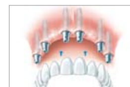
I overkæben: Bro på seks implantater