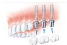
Tre enkelttænder på tre implantater