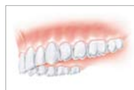
Naturligt udseende, naturlig funktion