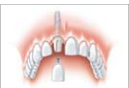
Det indsatte implantat med den nye tandkrone